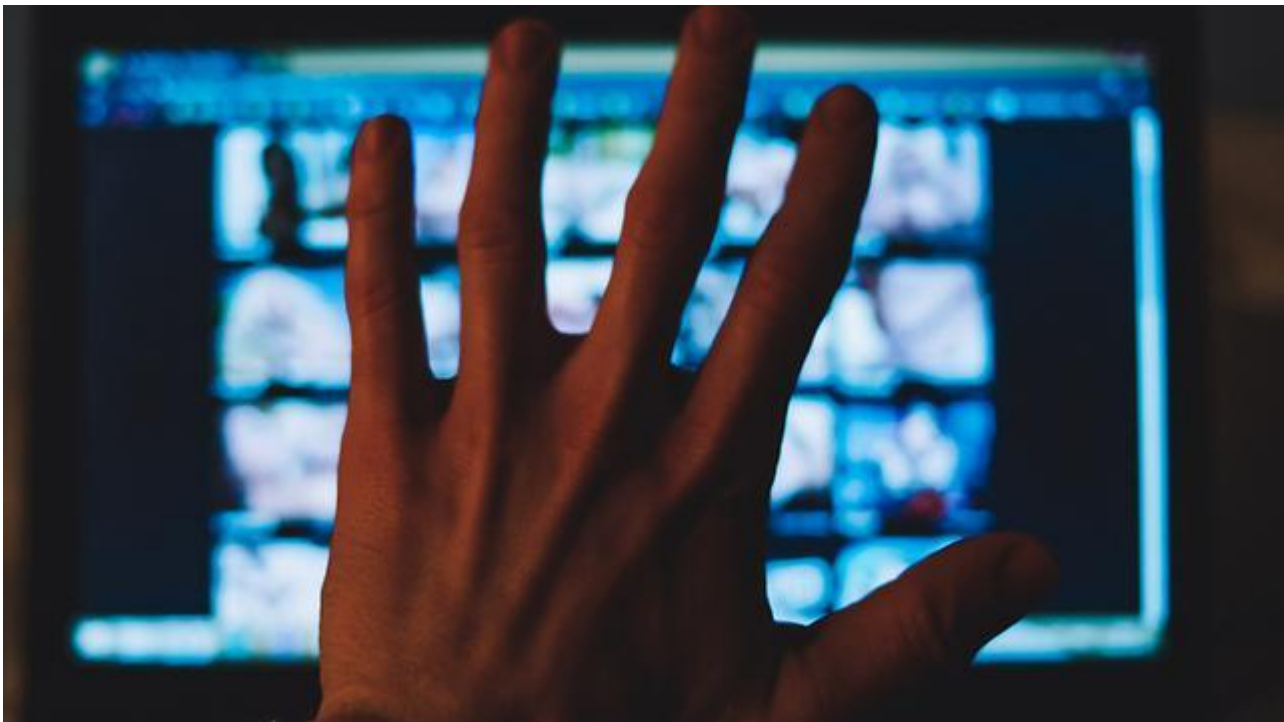
ילדים צעירים מאוד נכנסים לאתרי פורנו

"הצעירים השותפים לאונס קבוצתי הם בדרך כלל נערים בגיל ההתבגרות עד גיל 21-22. 80 אחוז מבני הנוער נגררים לדבר עבירה. עשרה אחוזים לא ייגררו לעולם אחרי אף אחד, עשרה אחוזים תמיד יבצעו עבירה. בעבירות מין תמיד יש את אלה שייגררו. בדרך כלל המוביל הוא אחד, השני יכול להיות אדם שצמוד אליו, לפעמים הוא אפילו יבצע רוע אכזרי יותר מהמוביל".